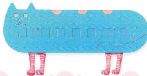
NS0317 Kot. Szlaczki na ścianę z aplikacją.