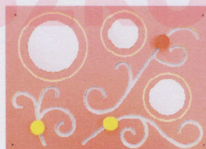
NS0995 z lusterkiem kwiaty