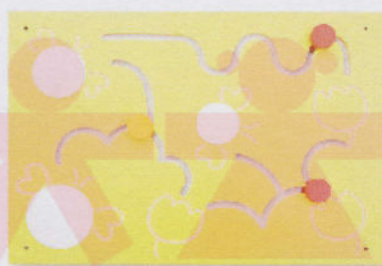
NS0992 z lusterkiem pszczoły