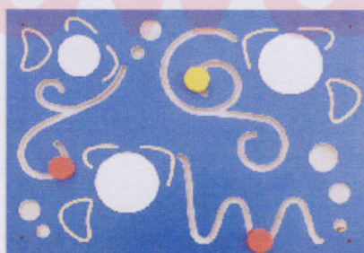
NS0994 z lusterkiem Ryby